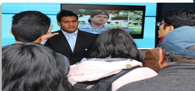
4ª Feria por el Día Internacional del Derecho al Acceso a la Información Pública

La CAN Anticorrupción participó activamente en tres eventos realizados por diversas instituciones, con el fin de sensibilizar a los ciudadanos en la lucha contra la corrupción, en el derecho al acceso a la información pública, con el propósito de fomentar actitudes y prácticas que los involucren de manera activa en el ejercicio de una ciudadanía real y efectiva para alcanzar una sociedad con equidad e inclusión y sensibilizarlos sobre la lucha contra la corrupción. ¿A quién le afecta tu corrupción? es el nombre del X Encuentro de Derechos Humanos, organizado por la IDEHPUCP en las instalaciones de la Universidad Católica del Perú y contó con la participación de los estudiantes de esa casa de estudios. En la plaza principal del distrito de Los Olivos, la Defensoría del Pueblo realizó una feria en el marco del Día Internacional del Derecho al Acceso a la Información Pública y la Plaza San Martín, fue el espacio escogido por la Municipalidad de Lima para la realización de la 4ª Feria en conmemoración de ese Día.